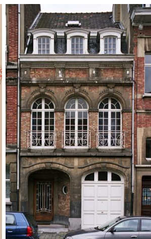
Vue des n°s 33 à 41 du boulevard Clovis en 2019 - Elévation d'origine, extraite du permis de 1923 – Vue du n°37 en 2007