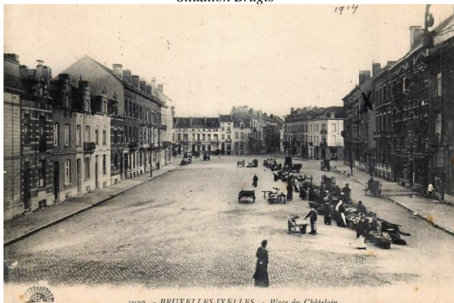
Carte postale de la place en 1914.