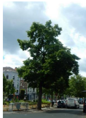
A gauche : schéma du réseau d'assainissement « Vivaqua ». Extrait de l'étude sur l'état sanitaire des arbres jointe au dossier, p.26 A droite : photo d'un des tilleuls, de la plantation d'origine. Photo extraite de l'étude sanitaire.

Veillez agréer, Madame la Directrice, l'expression de nos sentiments distingués.