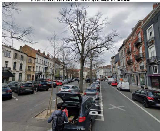
Vue de la place depuis la rue de l'Aqueduc.