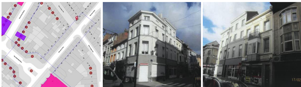
Contexte patrimonial (©Brugis), vue des nos 40 et 42 de la rue de la Paix (extr. du dossier de demande)

En réponse à votre courrier du 24/11/2022, reçu le 28/11/2022, nous vous communiquons l'avis émis par la CRMS en sa séance du 14/12/2022, concernant la demande sous rubrique.