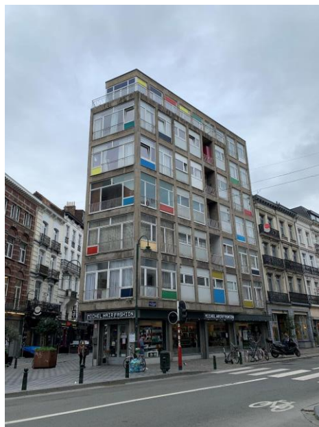
État existant