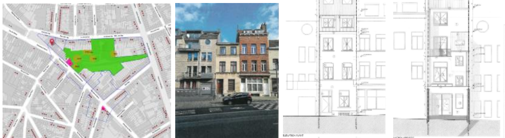
A gauche, extrait Brugis. Au centre, vue actuelle. A droite, situation projetée des élévations avant et arrière (extraits du dossier)

En réponse à votre courrier du 06/12/2022, nous vous communiquons l'avis émis par la CRMS en sa séance du 14/12/2022, concernant la demande sous rubrique.