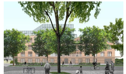
Photomontage projet amendé 2022 – docs. extr. du dossier de demande

Veillez agréer, Madame la Directrice Générale, l'expression de nos sentiments distingués.