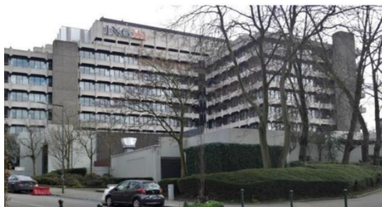
Bâtiment existant