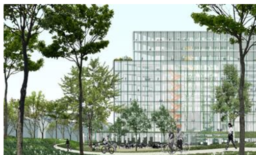
Photomontage du projet – le bâtiment ex. après rénovation lourde – extr. du dossier de demande

En ce qui concerne la rénovation lourde du bâtiment existant, construit en 1974-75 par l'architecte J. WYBAUW dans un style brutaliste, le projet n'a quasiment pas été modifié par rapport à la version