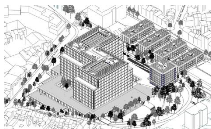
Projet amendé (2022)