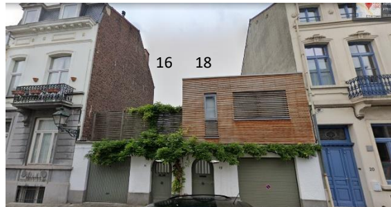
État actuel de la façade