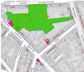
Implantation du bien

En réponse à votre courrier du 22/12/2022, reçu le 23/12/2022, nous vous communiquons l'avis émis par la CRMS en sa séance du 11/01/2023, concernant la demande sous rubrique.