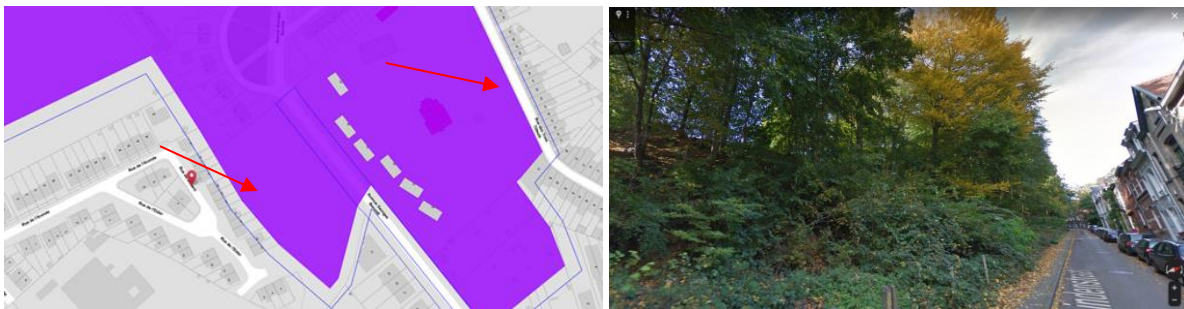
Les deux zones de la station « Talus des Trois Tilleuls » et vue de la rue des Trois Tilleuls

La station IA11 dénommée « Talus des Trois Tilleuls » regroupe deux talus assez pentus, orientés parallèlement et distants de 200m : celui bordant la rue des Trois Tilleuls et celui longeant le chemin du Busard, entre la rue du Busard et l'avenue Georges Benoidt. Ces deux talus se situent dans l'ensemble classé des cités-jardins des Logis-Floréal (AGRBC du 15/01/2001). La carte de Ferraris montre qu'il y avait déjà des parties en relief aux endroits où se trouvent aujourd'hui les deux talus, et qu'elles formaient un lien entre la vallée de la Woluwe et la forêt de Soignes, au sud, et une partie plus élevée, constituée de terres de culture, au nord.