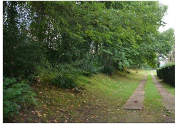
IA11_06. Mégaphorbiaie de lisière très modérément développée (zone 2). La pelouse peu développée (zone 4) devrait, sur une bande d'environ 2m de large à partir du pied des arbres et du recrû ligneux, n'être fauchée qu'une fois tous les deux ans. Le reste de la pelouse est suffisamment large pour le passage des promeneurs. (photo 2017)

Exemples des mesures de gestion à mettre en œuvre dans le Plan de Gestion Nature (extr. du dossier de demande)