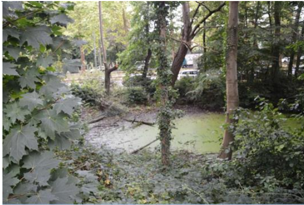
IB3_04 : la bande entre le Boulevard du Souverain et l'étang est très étroite. l'écran de châtaigniers et de verdure est efficace contre le piétinement et la décharge sauvage.