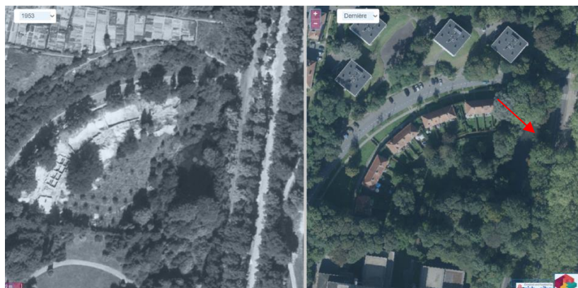
Le site de l'étang Floréal en 1953 et récemment