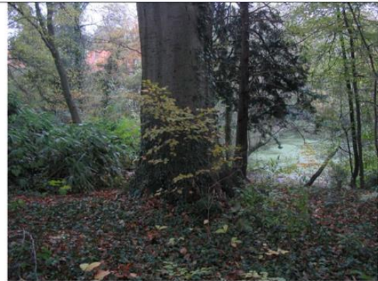
IB3_05 : zone forestière la plus haute (chênaie-hêtraie à Chêne sessile - habitat européen 9120, développement moyen d'espèces exotiques et de rhododendrons).

Vues et caractéristiques du site de l'étang (extr. du dossier de demande)