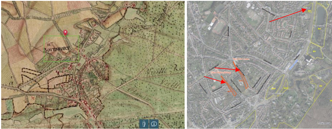
A g. : Carte de Ferraris et la rue des 3 Tilleuls pointée

Ces projets de plans de gestion ont été préparés par Bruxelles Environnement en application de l'ordonnance nature. Ils se déclinent chacun avec la même table des matières qui est divisée en quatre grands chapitres dont un descriptif de la station, les objectifs de gestion à atteindre, les difficultés et une description des mesures de gestion.