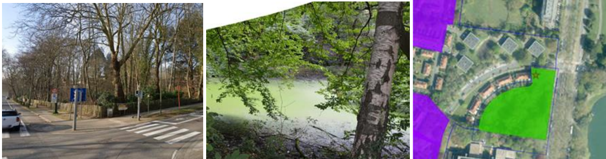
Vue de l'emplacement de l'étang, de la mare elle-même (extr. du dossier de demande) et de son contexte patrimonial (le Cèdre de l'Atlas est précisé par l'étoile)

La station IB3, à savoir l'étang « Floréal » ou « de Gerlache », se situe à l'angle de l'avenue des Archiducs et du boulevard du Souverain, en face du parc Ten Reuken. Il est classé comme site (AGRBC du 24/04/2016) et se situe dans la zone de protection de l'ensemble classé des cités-jardins. Un arbre remarquable, un cèdre de l'Atlas, occupe l'angle.