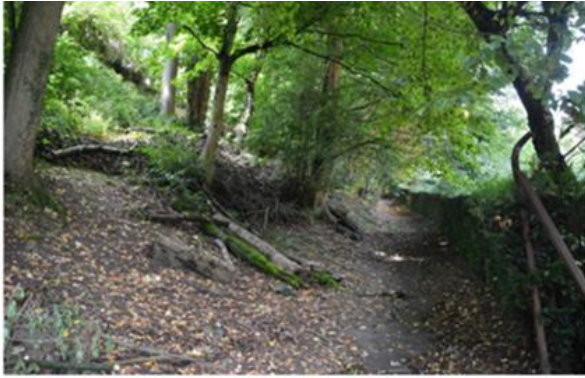
IA11_05. Le bois provenant d'éclaircies et de coupes de sécurité doit être laissé sur place. Les troncs coupés doivent être laissés au sol sur la plus grande longueur possible (aspect esthétique).. (photo 2017)