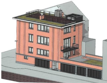
Extrait du dossier

L'immeuble actuel, d'expression architecturale sobre (modénature des baies, parement en briques claires, châssis et menuiseries blanches), se caractérise par une forme de retenue par rapport à l'immeuble voisin classé. La géométrie de la composition est sobre et simple : un niveau de fonctions de services au rez-de-chaussée sur lequel vient se poser un volume de trois niveaux d'appartements. Au niveau du volume d'appartements, les baies sont alignées entre les différents niveaux sans distinction, à l'exception de l'accès à la toiture terrasse du premier étage.