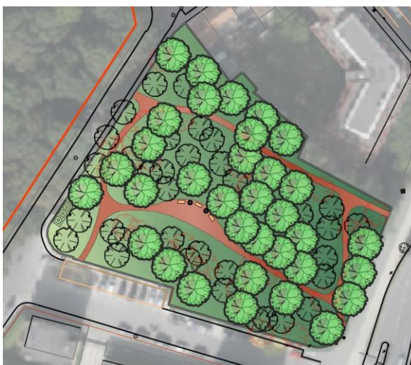
Plan des réaménagements projetés. Image extraite du dossier de demande.