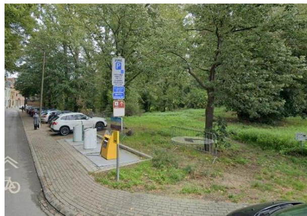
Vue sur les bulles à verre.