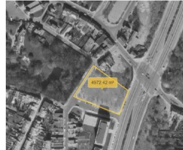
Localisation du site – 1977.