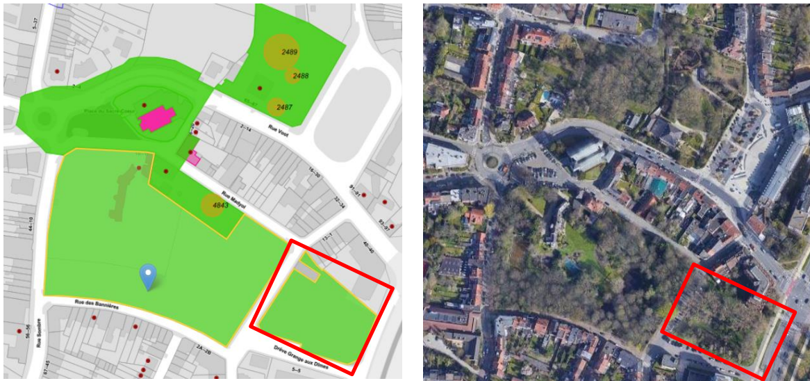
Emprise du site classé (en rouge zone de la présente demande)

S'agissant des aménagements, la CRMS préconise la réalisation d'un plan directeur qui concerne l'ensemble du site classé, et qui définit, selon une méthodologie ad hoc pour un dossier de patrimoine, des objectifs de projet qui permettront de renouer avec l'histoire, et l'intérêt historique et artistique du site (évoquer le passé hydrologique, favoriser la biodiversité...), qui lui vaut son classement.