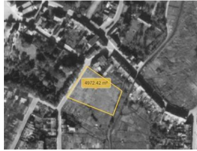
Localisation du site – 1944. bruciel.brussels