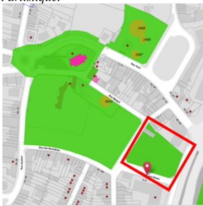
Localisation du site et situation

L'arrêté du Gouvernement de la Région de Bruxelles-capitale du 28/04/1994 classe comme monument le 't Hof van Brussel et comme site l'ensemble formé par l'édifice et ses abords en raison de leur valeur historique et artistique.