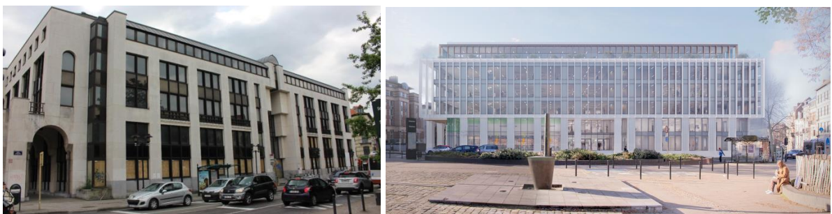
Façade donnant vers la place de Jamblinne de Meux, état existant et projeté (documents joints à la demande)

La Commission approuve la demande relative à l'immeuble Newton qui sera sans impact patrimonial sur la présence et la valorisation des arbres protégés. Elle se réjouit du parti qui consiste à rénover le bâti et non en une opération de démolition/reconstruction. La composition et la matérialité des façades rénovées sont soignées. Le langage proposé assume une expression contemporaine du bâtiment, tout en préservant des qualités urbanistiques initiales comme la présence de la colonnade de l'avenue de Cortenberg et le gabarit, qui bien que légèrement rehaussé, s'accorde adéquatement au contexte urbain.