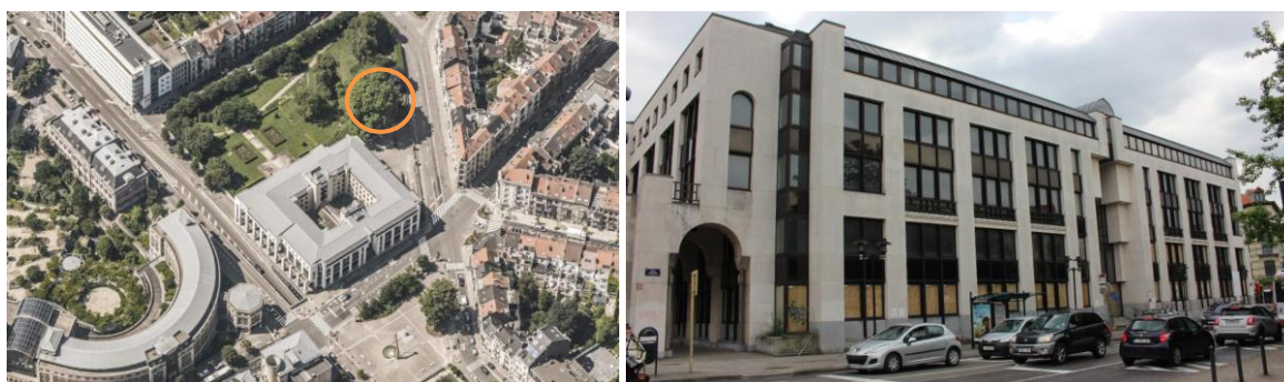
Implantation de l'immeuble Newton et du parc Juliette Herman (© Bing photos) et façade donnant vers la place de Jamblinne de Meux (urban@brussels)

La demande porte sur la rénovation lourde de l'immeuble de bureaux Newton implanté à l'angle de la place de Jamblinne de Meux et de l'avenue de Cortenberg ainsi que sur le réaménagement du parc Juliette Herman adjacent.