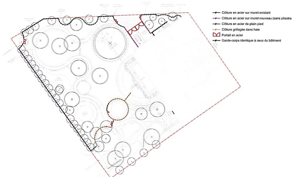
Plan d'implantation des nouvelles clôtures joint au dossier

Dans cette même optique, la CRMS est défavorable à l'abattage de trois arbres pour réaliser un « kiss & ride » : la justification de l'abattage est infondée au regard de l'état phytosanitaire des arbres et un dispositif de ce type ne se justifie pas dans une typologie classique de rue, et certainement pas en empiétant sur un parc.