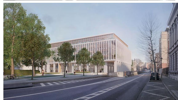
Immeuble Newton, angle place de Jamblinne de Meux et avenue de Cortenberg : situation existante et projetée