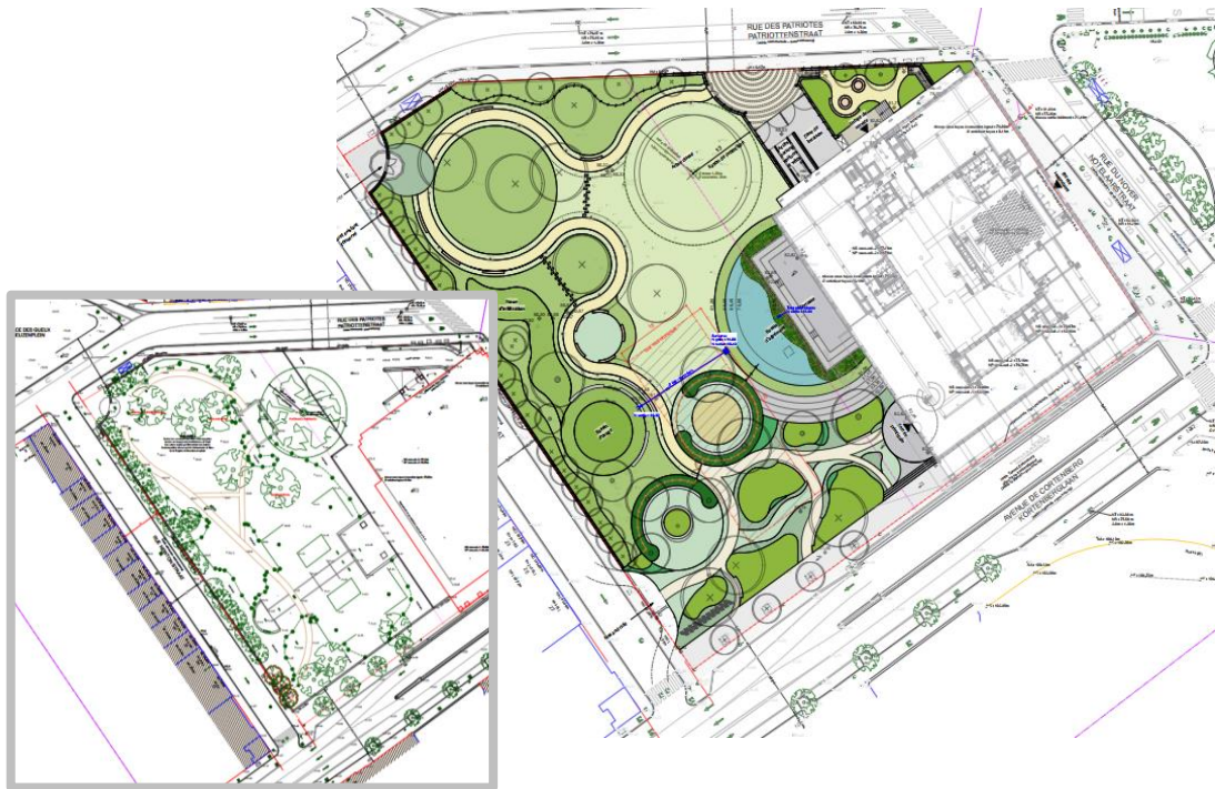
Plan d'aménagement du parc joint à la demande, situation existante et projetée

Le réaménagement du parc table sur une refonte totale du tracé selon le schéma ci-joint.