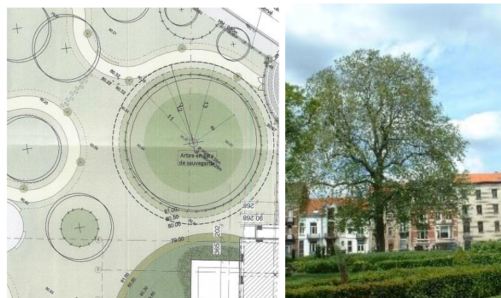
Extrait du plan d'aménagement du parc : zone du platane protégé comme site (extrait du plan joint au dossier, daté du 15/12/2022), arbre protégé

Pour le platane inscrit sur la liste de sauvegarde, le projet prévoit :