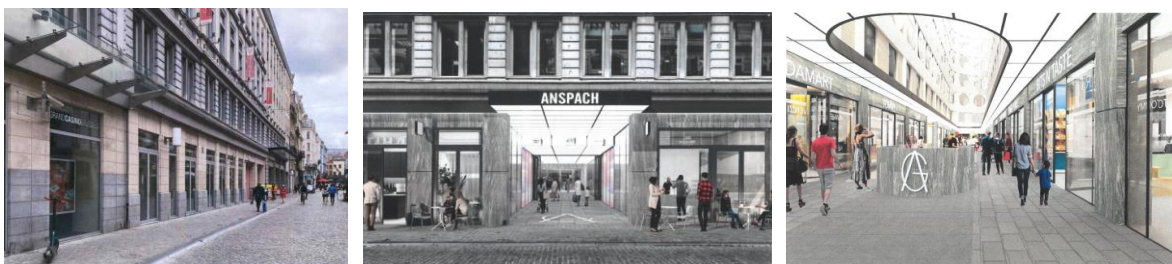
Bestaande en ontworpen toestand van de gevel aan de Grétrystraat en binnenluifel, documenten gevoegd bij de aanvraag