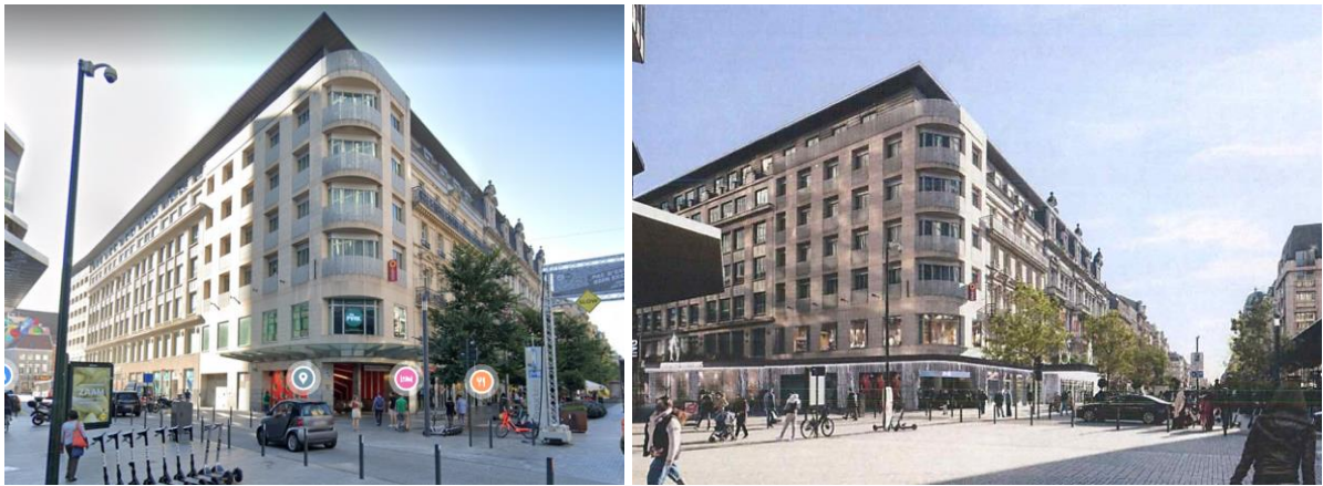
Toegang op de hoek van de Kleerkopers- en de Bisschopsstraat, uitgevend op het Muntplein (boven) en op de hoek met de Anspachlaan (onderaan), bestaande en ontworpen toestand, documenten gevoegd bij de aanvraag