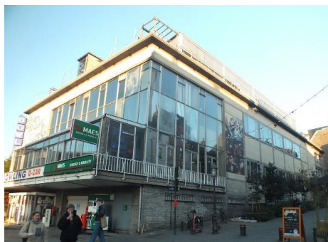
Vue du Bowling Crosly. Photo CRMS 2023