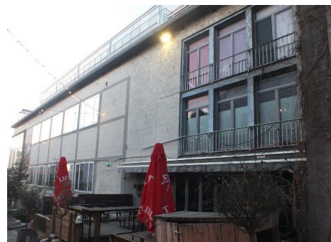
Vue du n°2 Rue de Rollebeek.

Le bâtiment du Bowling Crosly sis Boulevard de l'empereur 36-40, œuvre de l'architecte Léon Stynen en 1960-1961, figure à l'inventaire du patrimoine architectural. Le n°2 Rue de Rollebeek en fait partie.