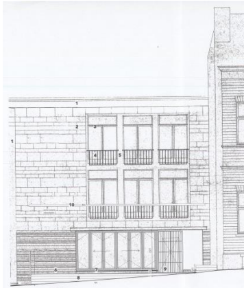
Situation de fait. Image extraite du dossier de demande