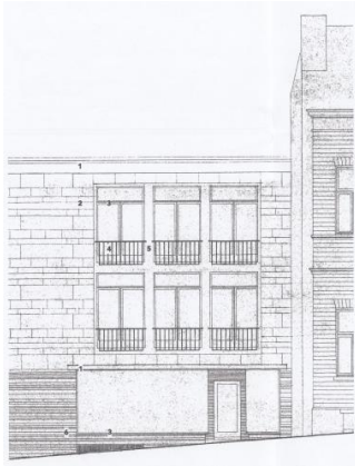
Situation de droit (1960). Image extraite du dossier de demande