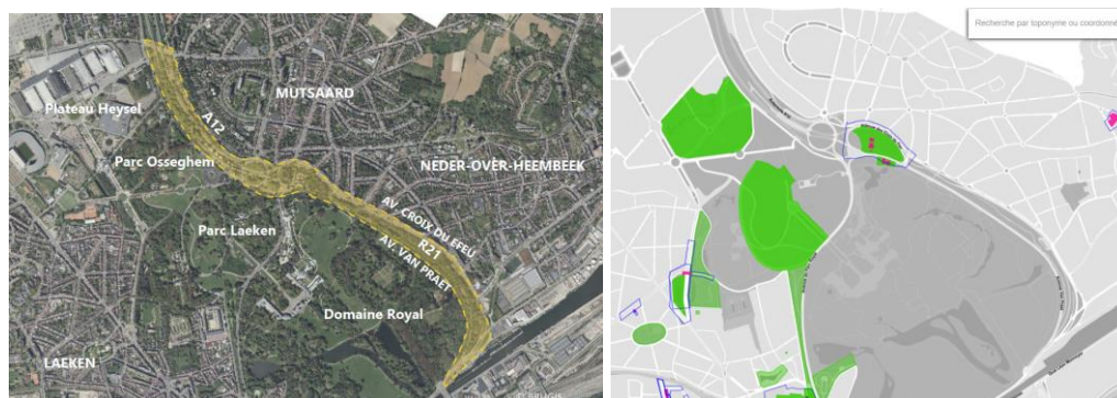
Périmètre d'intervention (document joint à la demande) et localisation des éléments patrimoniaux situés aux abords

La demande porte sur la transformation en boulevard urbain à caractère multimodal de l'espace public composé des avenues de Meysse, de Madrid, Jules Van Praet et des Croix du Feu ainsi que du tronçon sud de la chaussée de Vilvorde. Elle concerne la seconde mouture du projet, examiné une première fois par la CRMS en sa séance du 17/08/2022.