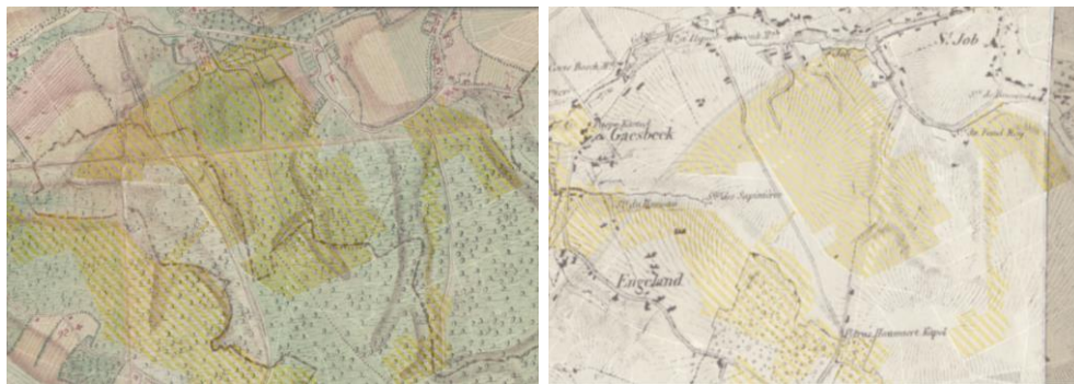
Évolution historique des sites : Plan Ferraris 1777 et plan Vandermaelen 1846-54

Les projets de PGN se déclinent pour chacune des stations avec la même table des matières, comprenant : 1°) le descriptif de la station (listes des habitats et des espèces), 2°) les objectifs de gestion à atteindre, 3°) les difficultés ainsi que 4°) la description des mesures de gestion.