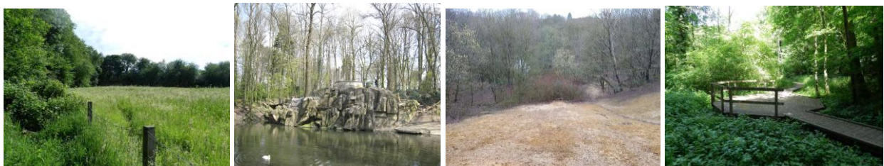
Situation actuelle des sites, de gauche à droite : Engeland, parc de la Sauvagère, Kauwberg, parc Fond’Roy (photos jointes à la demande)

Aujourd'hui, les quatre sites sont ouverts au public et gérés comme sites (semi-)naturels.