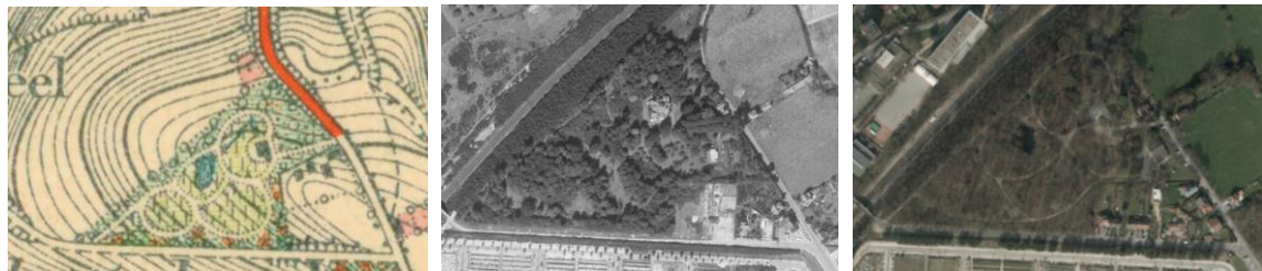
Tracé figuré sur la carte topographique de la Belgique, 1913 (document joint à la demande), situation 1953 et 2012

Selon la Commission, le PGN sous sa forme actuelle est incompatible avec l'intérêt patrimonial du parc dont le noyau est formé par le jardin de l'ancienne campagne, conçu par Jules BuysSENS en 1910 et structuré par une sélection particulière de plantations qui faisaient partie entière du concept paysager. Or en programmant l'enlèvement de toutes les essences exotiques et en limitant l'intérêt culturel et historique aux éléments construits (ponts, fontaines, fausses grottes, ...), le projet de PGN fait abstraction de la palette végétale historique qui avait été composée avec soin et comprenait aussi des espèces exotiques très recherchées à l'époque 2 . Même si la fonction du lieu a entre-temps évolué, les caractéristiques du jardin originel ont été partiellement conservées. La CRMS demande de les préserver à travers une gestion qui présente un équilibre plus adéquat entre les valeurs biologique et patrimoniale du parc.