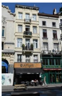
Vue de l'immeuble

En réponse à votre courrier du 23/03/2023, nous vous communiquons l'avis émis par la CRMS en sa séance du 29/03/2023, concernant la demande sous rubrique.