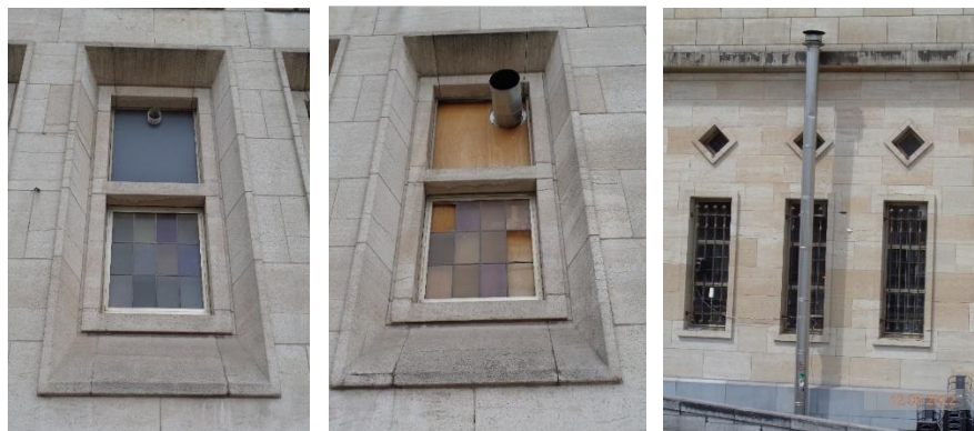
Bestaande toestand, zijde Kantersteen en zijde Kunstberg (foto's KCML)

Het regulariseren van de afvoerpijpen ter hoogte van de ramen aan de zijde Kantersteen en tegen de gevel aan de zijde van de Kunstberg kan niet worden toegestaan. De bestaande elementen zijn onesthetisch en weinig verzorgd uitgevoerd en passen niet in de bestaande erfgoedcontext. De inox afvoer van de CV-installatie vormt een erg storend element voor zowel de gevel als het zicht op de beschermde Beiaard. De KCML vraagt de bestaande elementen te verwijderen en de ramen aan de zijde Kantersteen in hun oorspronkelijke staat te herstellen. Er dient een esthetische, discrete en duurzame oplossing te worden gezocht.