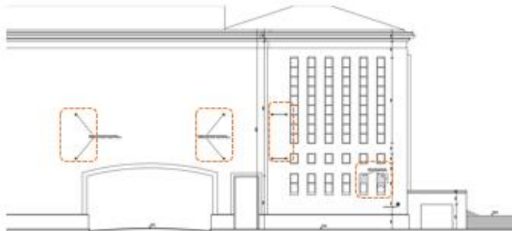
Gevels zijde Kantersteen, Kunstberg: foto's en ontwerpplannen gevoegd bij de aanvraag

Het dossier beoogt het regulariseren van volgende elementen :