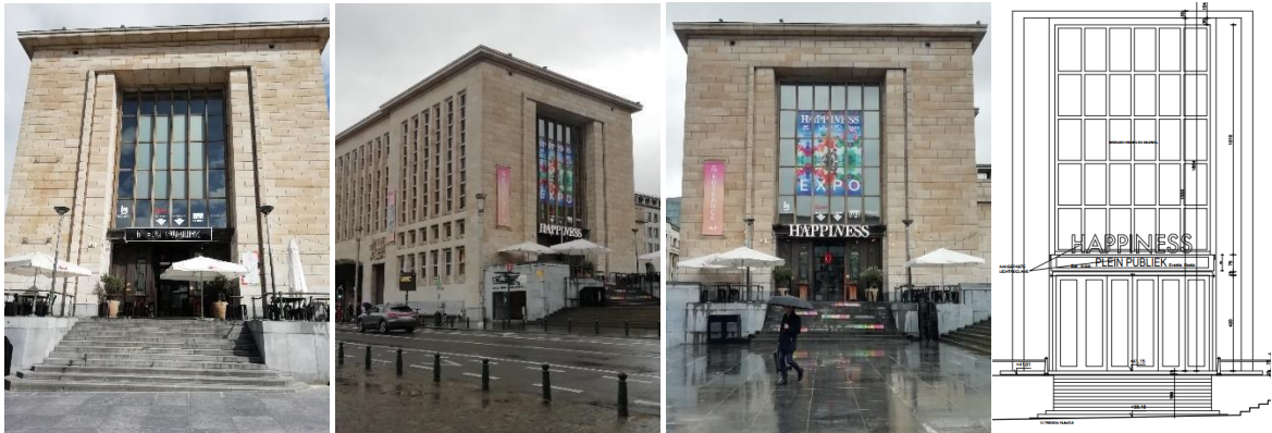
Gevel aan de zijde van het ruitersstandbeeld : van links naar rechts 'bestaande' toestand volgens de aanvraag, bestaande toestand sinds 29-03-2023 en ontwerp van de nieuwe lichtreclame gevoegd bij de aanvraag

De Commissie stelt vast dat de nieuwe lichtreclame "Happiness" al werd geplaatst boven de toegangspoort en dat er vinyls werden gekleefd op de traptreden van het bordes en tegen het raam boven de toegang. Deze elementen komen de erfgoedwaarde van deze zone van de Kunstberg niet ten goede. Ze wijken bovendien af van het ingediende ontwerp en werden eveneens geplaatst zonder vergunning. De KCML kan de plaatsing van deze elementen niet goedkeuren en vraagt ook hier naar een beter geïntegreerde oplossingen te zoeken die strookt met het erfgoedkarakter en de kwaliteit van gevrijwaarde het geheel en landschap.