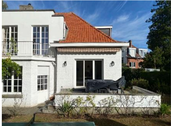
Vues des façades avant, arrière et latérale Ouest (extr. du dossier de demande)

La demande porte sur les points suivants :