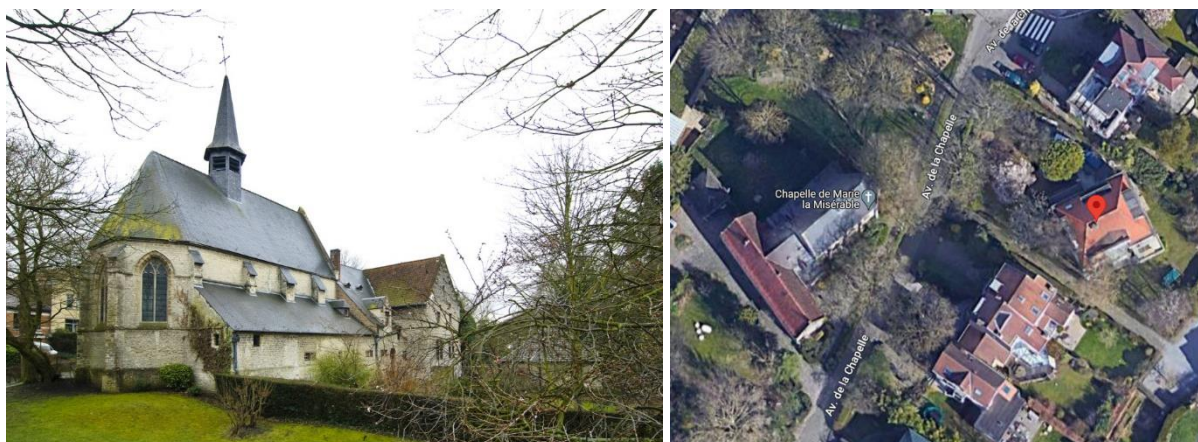
Vue de la chapelle classée et vue aérienne de la maison et de la chapelle

La maison concernée se situe face à la chapelle de Marie de Woluwé - ou « Marie la Misérable » - classée comme monument. Elle est reprise en zone ZICHEE et dans le périmètre du PPAS n°13 « Quartier J.F. Debecker » du 25/05/2000, dont les prescriptions soulignent que « tout projet relatif à la transformation, l'extension ou reconstruction des bâtiments compris dans le périmètre d'Intérêt Culturel, Historique et Esthétique et/ou de l'Embellissement au projet de PRAS sera soumis à l'examen de la CRMS ». La maison remonte également, d'après la note explicative, à avant 1930 et serait de facto reprise à l'Inventaire légal d'avant 1932. La situation de droit remonte à 1966 (plans de l'architecte Henri Meeus).