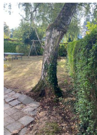
Coupe projetée avec l'isolation en sarking, plan de la parcelle avec l'abattage prévu et vue du bouleau situé à l'arrière (extr. du dossier de demande)