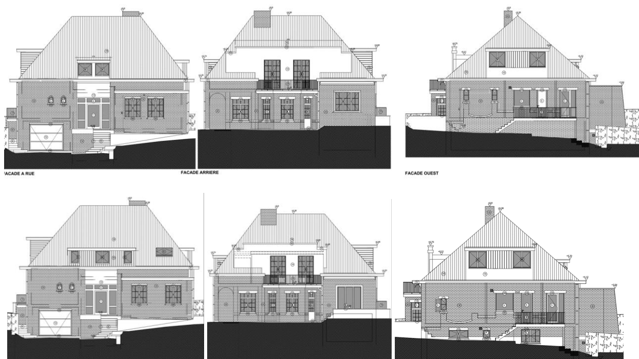
Elévations des façades à rue, arrière et ouest : situations de droit et de fait (à régulariser) (extr. du dossier de demande)