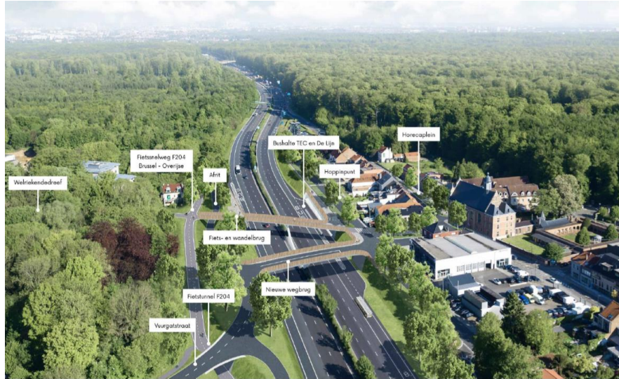
Fotomontage van het project, gevoegd bij de aanvraag

Het huidige projectgebied is voor het grootste deel gelegen op Vlaams grondgebied. Een klein deel ervan ligt binnen het Brussels hoofdstedelijk Gewest, op het grondgebied van de gemeente Watermaal-Bosvoorde. Hier overlapt het projectgebied een strook van het Zoniënwood, beschermd als landschap bij besluit van 02/12/1959 .