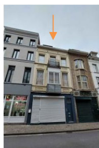
État actuel et projeté de la façade, photo et plan joints à la demande