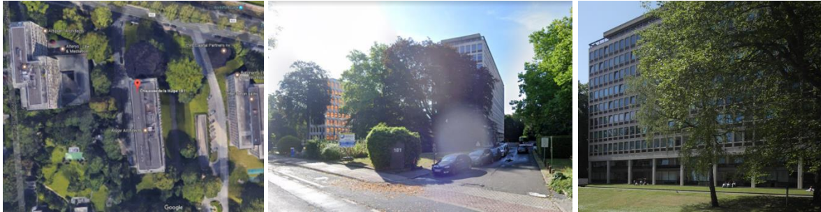
Vues aérienne et depuis la rue de l'immeuble de bureaux (©Google maps) – Vue du bâtiment https://monument.heritage.brussels/fr/Watermael-Boitsfort/Chaussee_de_La_Hulpe/181/26282

Patrimoine architectural et un hêtre pourpre, situé à l'avant du bâtiment, de plus de 200 ans, est inscrit comme site sur la liste de sauvegarde. « Il a l'allure typique du vieux hêtre qui a pu se développer sans entraves : son tronc massif se subdivise en deux énormes branches charpentières qui donnent naissance à une couronne en dôme aussi haute que large. Sa hauteur vaut environ 25 mètres, pour une envergure de 28 mètres. Il est bien visible de la voirie. » (extr. de l'arrêté de sauvegarde – AGRBC du 10/03/2002)