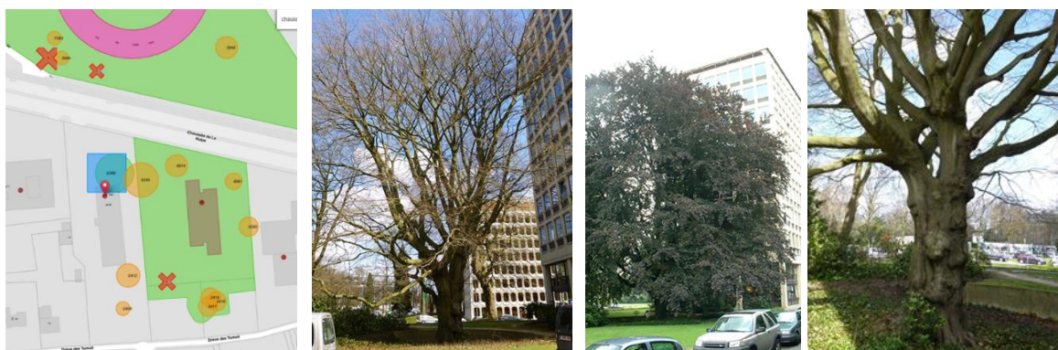
Contexte patrimonial (©Brugis) et vues du hêtre pourpre (inscrit sur la liste sauvegarde comme site)

https://sites.heritage.brussels/fr/trees/2389