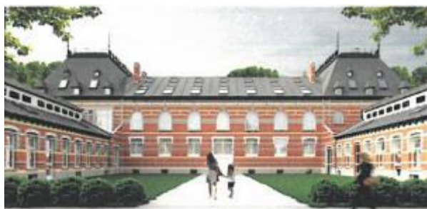
Image de synthèse de l'aménagement prévu à l'arrière de la grande clinique. Vu en séance du 02/09/2020.

des voitures dans le site qui pour le reste, sera évaluée dans le cadre du plan paysager en cours d'élaboration incluant l'aménagement de 116 places de parkings. » 2