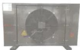
Exemple d'un modèle de pompe à chaleur. Image tirée du dossier.

La demande porte sur l'installation de pompes à chaleur externes hors-sol (PAC) pour les différents logements et parties communes aux abords du bâtiment central (Grande Clinique) de l'école des Vétérinaires. L'implantation proposée pour l'ensemble des pompes se situe en partie avant et arrière, dans les parties privatives. Les unités PAC, hors sols, seront rangées sous des éléments décoratifs en bois ajourés et espacés par des haies calibrées sur la hauteur des pompes.