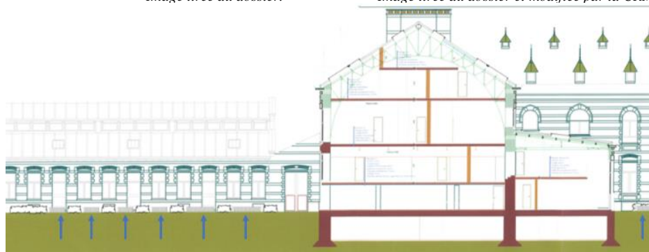
Coupe avec la localisation des pompes à chaleur (indiquées par des flèches bleues). Image tirée du dossier et modifiée par la CRMS

Image tirée du dossier et modifiée par la CRMS