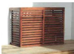
Modèle d'un caisson en bois protégeant les pompes à chaleur. Image tirée du dossier.