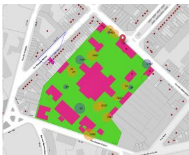
Situation Brugis ©

En réponse à votre courrier du 04/05/2023, nous vous communiquons l'avis défavorable émis par notre Assemblée en sa séance du 10/05/2023, concernant la demande sous rubrique.