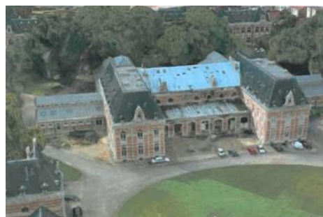
Vue aérienne de la grande clinique

L'arrêté du Gouvernement de la Région de Bruxelles-Capitale du 22/02/1990 classe comme monument les façades et les toitures des bâtiments originels de l'école des vétérinaires de Cureghem et comme site l'ensemble formé par ces bâtiments et le parc dans lequel ils sont érigés.