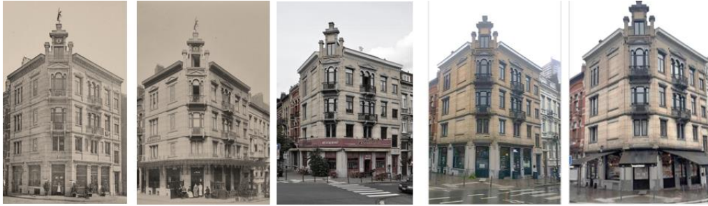
Façades vers 1906, 1910 et 2012, état avant et après la pose des tentes solaires (photos jointes au procès-verbal du 22/12/2022 et à la demande)

Récemment, en date du 21/04/2022, la Commune a délivré un permis d'urbanisme autorisant la mise en conformité de certains aménagements intérieurs et de certaines modifications en façade avant (15/AFD/1772339, avis CRMS du 25/08/2021). L'autorisation était notamment justifiée par le point suivant : « 14. Considérant que les tentes solaires non couvertes par un permis d'urbanisme sont retirées ».