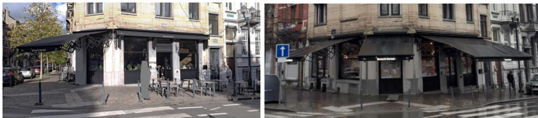
État existant du rez-de-chaussée commercial (photos jointes à la demande et au procès-verbal du 22/12/2022)