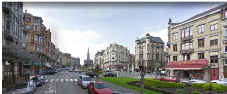
Perspective urbaine, état 2009 (Google Streetview)

De manière générale, la CRMS insiste pour une gestion d'ensemble et cohérente, relative à l'expression commerciale des Horeca qui bordent l'avenue Louis Bertrand. En particulier, il conviendrait d'homogénéiser l'expression commerciale, auvents et terrasses, des immeubles qui forment l'angle avec les rues J. Brand et H. Bergé. Il s'agit d'une séquence urbanistique significative composée de part et d'autre de l'immeuble monumental qui sépare les deux rues.