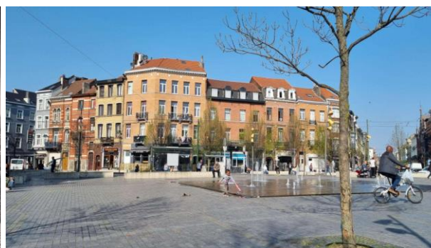
Erfgoedlocatie van het pand, gevelfront eind 19 de eeuw en huidige toestand

Het dossier heeft betrekking op het goed gelegen aan het Raadsplein 4 waarvan de voorzijde zich bevindt in de vrijwaringszone van het Gemeentehuis van Anderlecht, beschermd als monument. Het perceel omvat een pand aan de straatzijde in neoclassicistische stijl dat dateert van 1879 en dat aansluit op een industriële