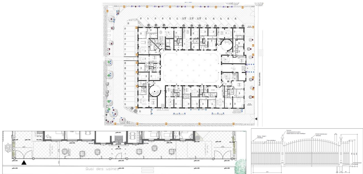
Plan d'aménagement des abords et modèle de grille proposée (documents joints à la demande)

La Commission n'est pas favorable à l'implantation de la clôture projetée à front de rue. Très haute et imposante, elle altèrera la lecture des façades et leur scénographie, en raison de son aspect assez massif et du peu de recul qui subsistera devant l'immeuble. Afin de préserver les vues sur et depuis le bien classé, la Commission demande de renoncer à une clôture haute devant les façades classées et de libérer visuellement la zone de recul. Ceci n'empêche pas d'installer des portillons plus hauts à hauteur des entrées carrossables latérales, mais pas devant la façade principale . Si nécessaire, la zone de recul pourrait être limitée par une grille basse de facture simple (végétalisée).