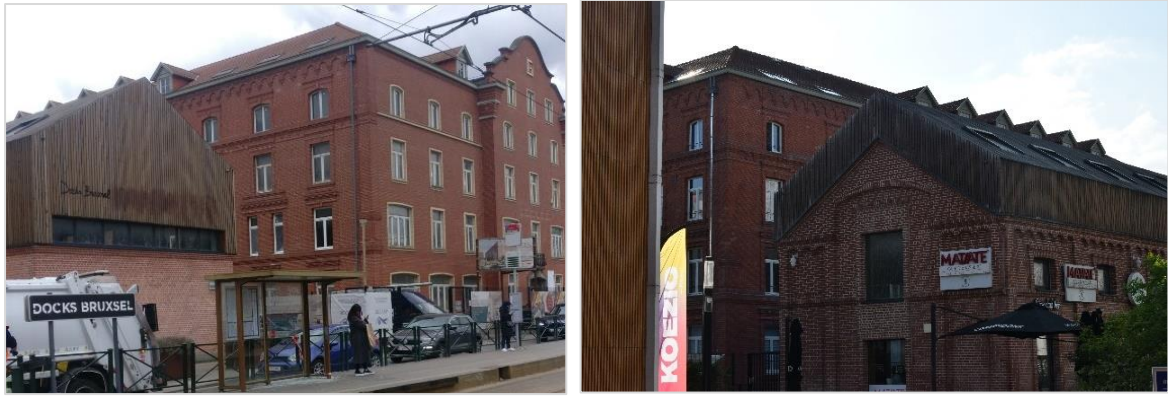
Parties avant et arrière des toitures, situation mai 2023

Considérant que les nouvelles ouvertures de toitures ne nuisent pas à la charpente et aux structures récentes et qu'elles ne sont pas préjudiciables à la lecture globale du monument (versants pentes faibles, verrières formant écran par rapport aux interventions en toiture côté intérieur), la CRMS rend un avis favorable sur les éléments installés en cours de chantier.