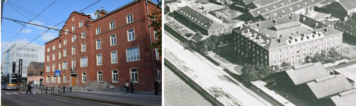
État de la zone de recul en mai 2023 et configuration en 1932

Déjà partiellement réalisé, ce volet du projet intègre un chemin périphérique, des emplacements de parkings, quelques zones plantées ainsi qu'une clôture longeant l'espace public.