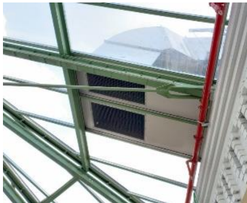
Situation existante du lanterneau et détail des grilles d'extraction

Selon la CRMS, cette nouvelle solution présente une amélioration par rapport à la proposition initiale qui prévoyait de suspendre des dispositifs à la verrière, mais qui a été écartée pour des raisons structurelles. Étant donné l'impact visuel moindre de l'installation actuelle par rapport au projet précédent, la Commission émet un avis favorable sur ce point à condition que la teinte des panneaux grillagés soit affinée pour une meilleure intégration visuelle à la verrière.