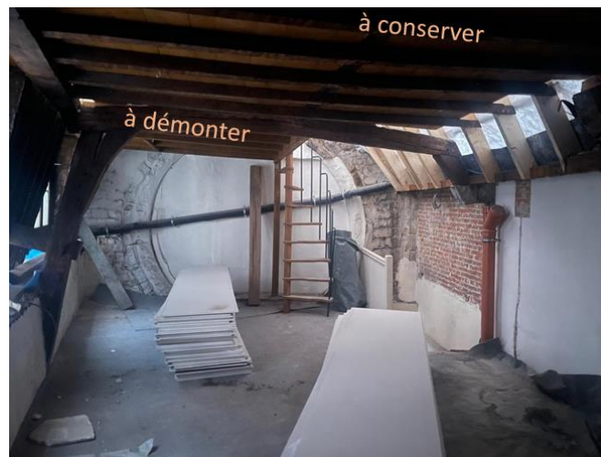
Plan de second étage joint à la demande de permis et état de la grande chambre du n° 5 en cours de chantier (documents joints aux demandes respectives)

La CRMS se prononce favorablement sur cette modification qui s'est imposée en cours de chantier.