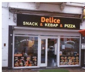
État existant de la vitrine (documents joints à la demande)