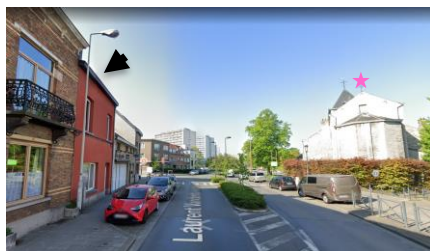
Localisation du bien par rapport à l'église classée et indication de la zone d'intervention, jointe à la demande