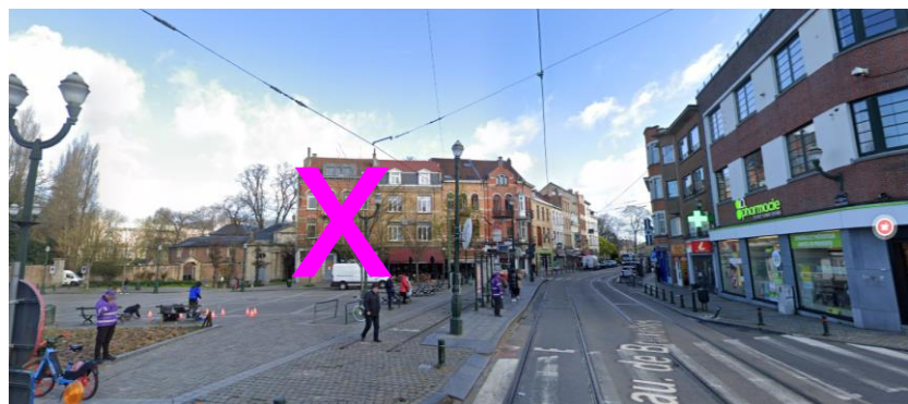
Maison à démolir

Le chantier de démolition a débuté il y a un mois. Les archéologues ont effectué, par l'intérieur, les relevés du pignon qui sera découvert suite à la démolition, à réaliser) de la maison sise au nr sise place Saint-Denis 6-7. Ils ont mis à jour – comme prévu – les traces des baies de l'ancienne façade latérale du pavillon Est, conçu par L.-B. Dewez.