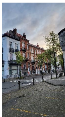
Inplanting van het goed t.o.v. de beschermde gevangenisgebouwen