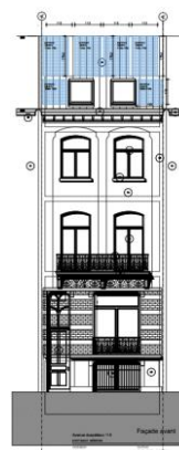
Inplanting van de photovoltaïsche panelen, plan gevoegd bij de aanvraag

Volgens de KCML hebben de voorgestelde zonnepanelen geen negatieve impact op de zichten van en naar het tegenoverliggende, beschermde gevangeniscomplex. Op erfgoedvlak roept deze installatie dan ook geen bezwaar op.