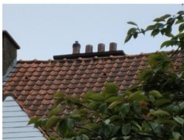
Square de la Frégate

La demande vise à installer des dispositifs d'évacuation des gaz brûlés des chaudières à condensation intégrant une entrée pour l'alimentation en air sur les cheminées existantes.