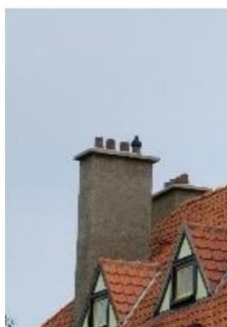
Rue des Pétunias