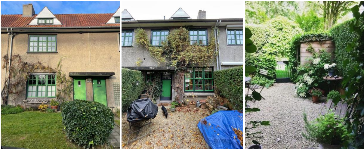
Vues de la façade avant, de la façade arrière et du jardin (extr. du dossier de demande)

La demande actuelle porte sur la régularisation de l'aménagement du jardin arrière, à savoir la construction d'un abri de jardin et la modification du revêtement de sol. L'abri de jardin (dimensions 1,6m x 1,2m) est en bois de cèdre (planches et bardeaux), qui a grisé depuis son installation en 2012. Il longe la haie et est ouvert côté jardin, afin d'abriter deux vélos. Après divers essais infructueux (gazon remplacé en 2012 sans succès, ensuite mise en place d'une sous-couche drainante, nouvel essai de pelouse...), la pelouse – dont l'herbe n'avait jamais correctement poussé - a été remplacée par un revêtement en dolomie en 2014. Le périmètre de la dolomie a ensuite été étendu à l'ensemble de ce petit jardin.