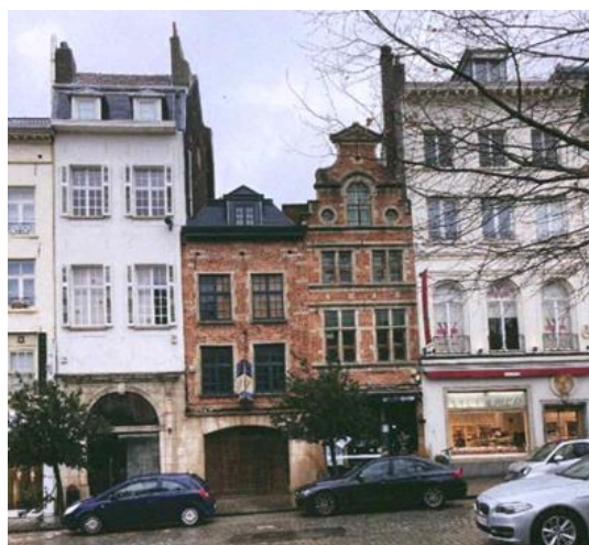
Contexte patrimonial et vue des maisons n°8-9-10 et 12 (extr. du dossier de demande)