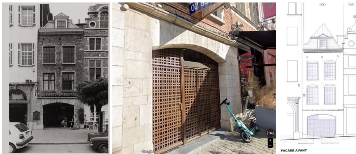
Vue ancienne de la maison n°9 (©urban.brussels), vue de la grille actuelle (©Google maps) et élévation existante (extr. du dossier de demande)

En 2020, un avis de la CRMS répondait déjà à une demande de changement d'affectation du rez-de-chaussée de la maison n°9, à une modification de la devanture et à certaines transformations intérieures. ( https://crms.brussels/sites/default/files/avis/651/BXL21648_651_GrandSablon_8-9_11.pdf )