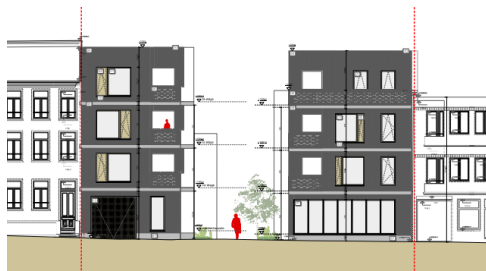
Situation projetée – projet 2022