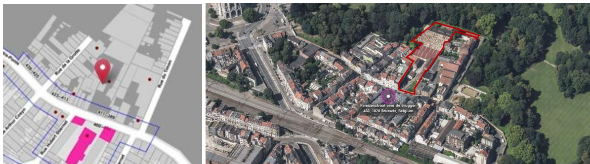
A gauche, extrait Brugis. A droite, vue aérienne avec zone d'intervention en rouge

En réponse à votre courrier du 30/05/2023, reçu le 05/06/2023, nous vous communiquons l'avis émis par la CRMS en sa séance du 21/06/2023, concernant la demande sous rubrique.