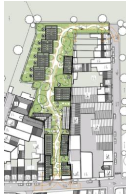
Implantation en situation projetée (extraits du dossier)