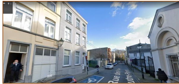
Vue actuelle de la première Maison communale de Laeken dans la rue des Palais Outre-Ponts