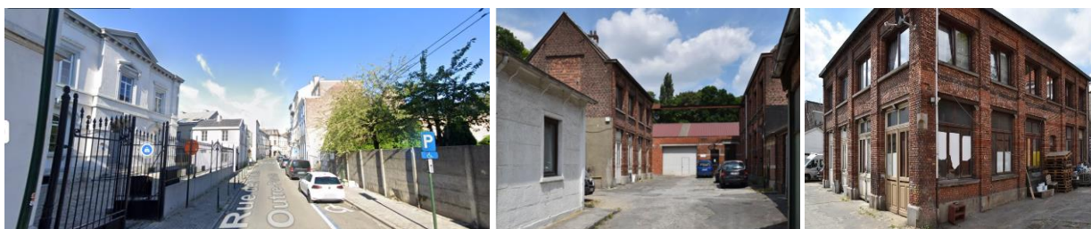
A gauche, vue actuelle de la première Maison communale de Laeken dans la rue des Palais Outre-Ponts Au centre et à droite, vues du site et des bâtiments repris à l'inventaire (extraits du dossier)

La demande concerne le site industriel des anciennes Carrosseries François Van Damme construit entre 1910 et 1951. Il est repris à l'inventaire du patrimoine architectural de la Région de Bruxelles-Capitale. 1 La partie avant de la parcelle est comprise dans la zone de protection de la première Maison communale de Laeken, sise rue des Palais Outre-Ponts, 458-460. 2 Le reste du terrain, en intérieur d'îlot, relie les rues des Palais Outre-Ponts et du Timon et jouxte le domaine royal au nord et à l'ouest, ainsi qu'une série de constructions en intérieur d'îlot à l'est.