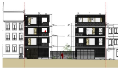
Situation projetée – projet 2023

Le projet vise la démolition d'une grande partie des bâtiments industriels et la création d'un clos ouvert comprenant 17 nouvelles maisons unifamiliales et 13 appartements autour d'un espace vert commun avec un sous-sol comprenant 22 places de parking, des caves et des locaux techniques.