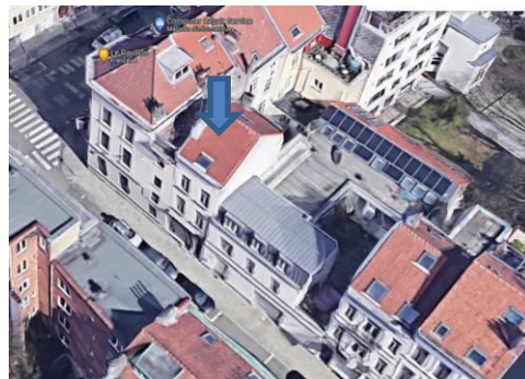
Vue aérienne