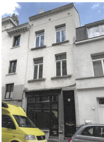
Photo actuelle de la façade