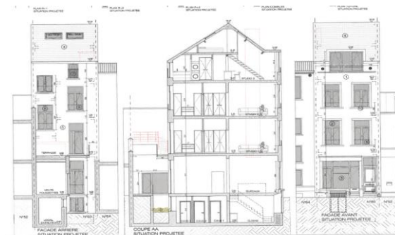
Situation projetée – façade arrière, coupe, façade avant.