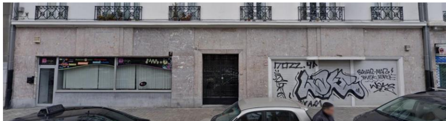
Situation actuelle

La proposition est une amélioration de la situation existante, la CRMS s'en réjouit.