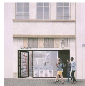
Nieuwe voorgevel met uithangborden (andere vergunningsaanvraag)