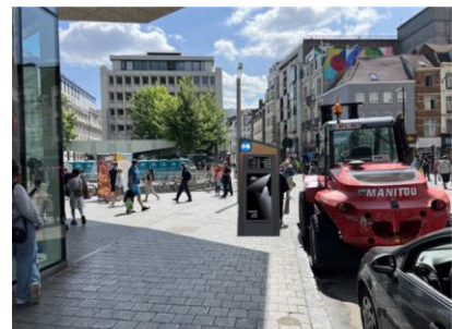
Angle avec la Place de la Monnaie Photomontage situation projetée Images extraites du dossier de demande