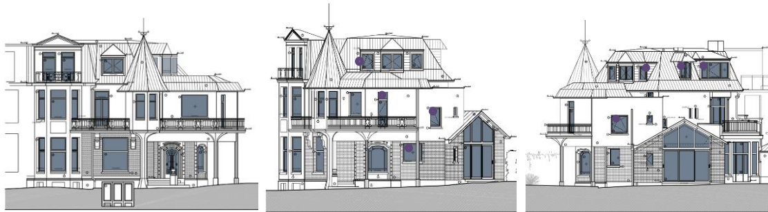
État projeté des façades, élévations jointes à la demande

La maison de droite (vue depuis la rue), concernée par la demande, a subi plusieurs transformations tout en conservant une typologie assez proche de l'origine. Par permis de 1955 et de 1960/62 ont, outre la réorganisation intérieure, été autorisés l'ajout de lucarnes en toiture, l'aménagement d'un garage en sous-sol ainsi que la création d'une extension au-dessus du hall d'entrée. Celle-ci se présente sous forme d'un volume en porte-à faux reposant sur deux colonnes en béton.