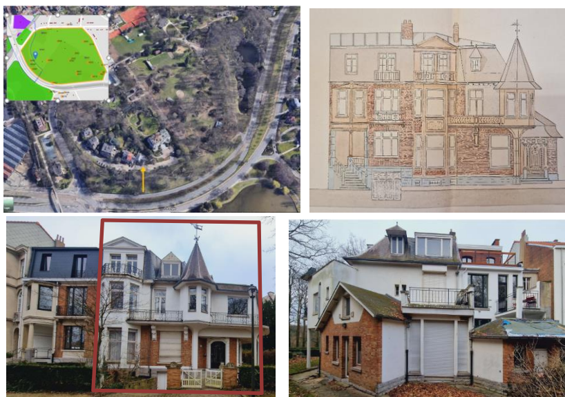
Implantation du bien, plan d'archive et photos de la situation existante joints à la demande

En réponse à votre courrier du 14/03/2024, nous vous communiquons l'avis favorable émis par notre Assemblée en sa séance du 03/04/2024, concernant la demande sous rubrique.