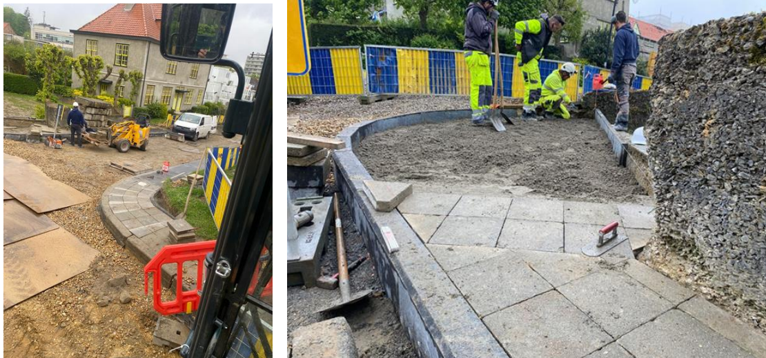
Angle Nord-Est refait en 'quartiers de tarte' et angle Nord-Ouest en cours de réfection (extr. du dossier de demande)

A l'occasion du chantier en cours, il est proposé d'harmoniser les quatre angles de ce carrefour par des finitions arrondies, les courbes ainsi créées offrant une protection améliorée contre les dégâts perpétrés par la circulation, notamment celle des camions. La pose des dalles est aussi sujette à un questionnement, l'option proposée étant de faire des rangées continues en créant des 'quartiers de tartes', tel qu'effectué dans l'angle nord-est.