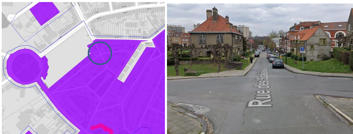
Contexte patrimonial avec le carrefour Scabieuses-Ellébores – Vue du carrefour en 2019

En réponse à votre courrier du 14/05/2024, reçu le 15/05/2024, nous vous communiquons l'avis favorable sous conditions formulé par la CRMS en sa séance du 15/05/2024, concernant la demande sous rubrique.