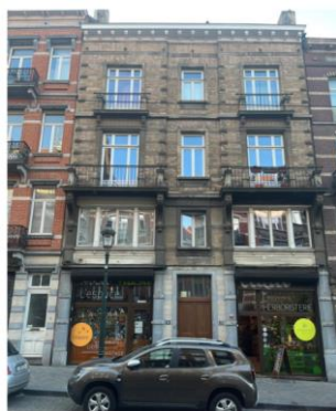
Façade avant et situation projetée des menuiseries du 1 er étage (documents extraits de la demande)