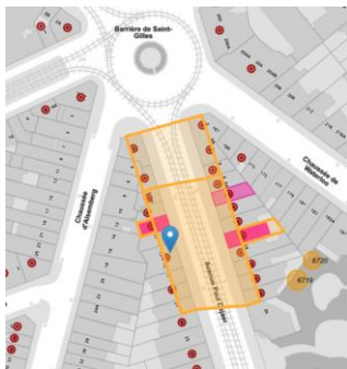
Localisation du projet (© Brugis)

En réponse à votre courrier du 30/05/2024, nous vous communiquons l'avis émis par la CRMS en sa séance du 05/06/2024, concernant la demande sous rubrique.