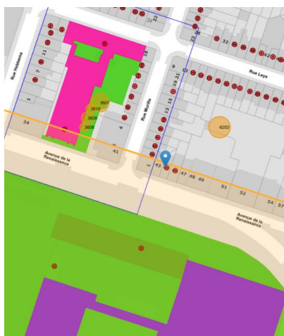
Contexte patrimonial

En réponse à votre courrier du 17/06/2024, reçu le 19/06/2024, nous vous communiquons l'avis émis par la CRMS en sa séance du 26/06/2024, concernant la demande sous rubrique.