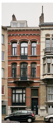
Façade avant