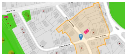
Contexte patrimonial

En réponse à votre courrier du 18/06/2024, nous vous communiquons l'avis émis par la CRMS en sa séance du 26/06/2024, concernant la demande sous rubrique.