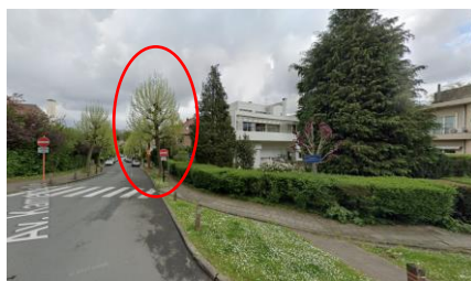
Vue du carrefour entre l'avenue du Manoir et l'avenue Kamerdelle, maison Génicot classée et arbre d'alignement dont l'abattage est prévu