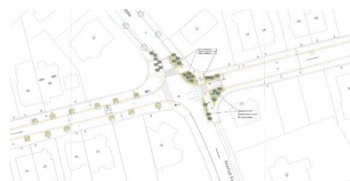
Situation projetée (document extrait du dossier de demande)