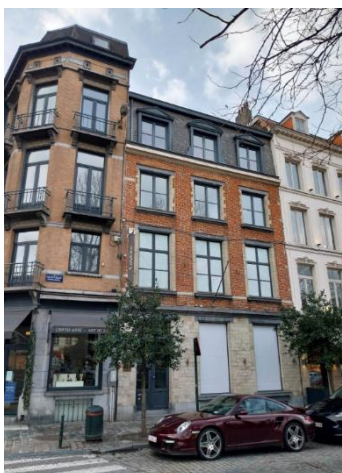
Façade avant (photographie extraite du dossier de demande)