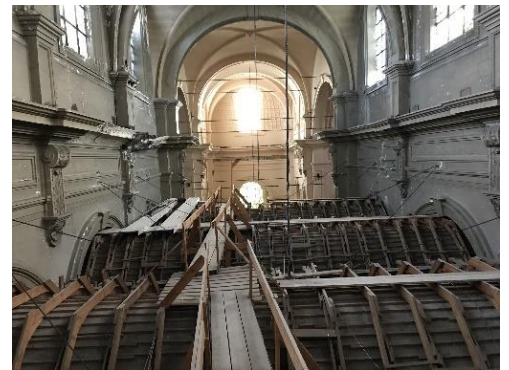
Intérieur de l'église avec vue sur les voûtes et sur l'extrados du faux plafond