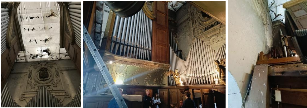
État existant de l'orgue : de gauche à droite, bâche de protection provisoire, configuration des parties latérales et centrale, position de l'instrument contre la façade principale

La CRMS n'appuie pas la demande de classement de l'orgue de l'église de la Ste-Trinité. Cette position est justifiée pour les raisons suivantes, à la suite de sa visite sur place le 03/09/2024.