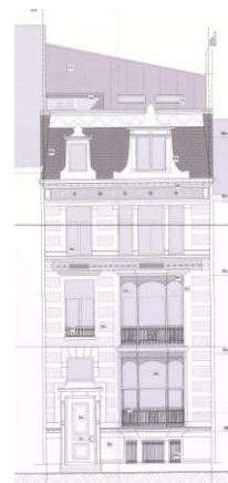
Façade avant. Situation projetée. Image tirée du dossier

Les interventions extérieures, situées en toiture, n'auront pas d'impact négatif sur les vues vers et depuis les maisons Art-Nouveau classées et relèvent d'un examen urbanistique plutôt que patrimonial. À l'intérieur, la CRMS demande de veiller à ce que les décors d'origine à valeur patrimoniale soient au maximum maintenus et préservés.