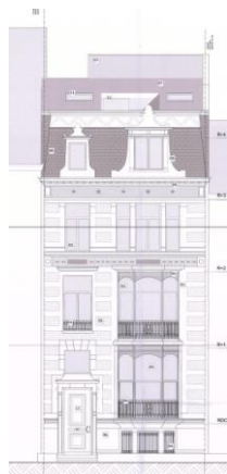
Façade avant. Situation de fait. Image tirée du dossier