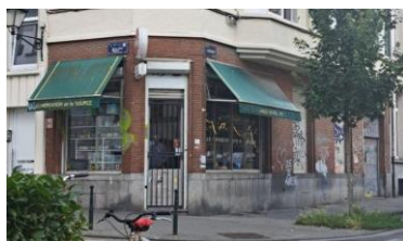
Situation existante

En réponse à votre courrier du 24/09/2024, nous vous communiquons l'avis émis par la CRMS en sa séance du 16/10/2024, concernant la demande sous rubrique.