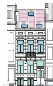
Extr. de la demande

Le bien concerné par la demande est partiellement situé dans la zone de protection de l'église Saint-Servais et inscrit à l'inventaire du patrimoine architectural. Il s'agit d'une maison traditionnelle de style éclectique construite en 1895.