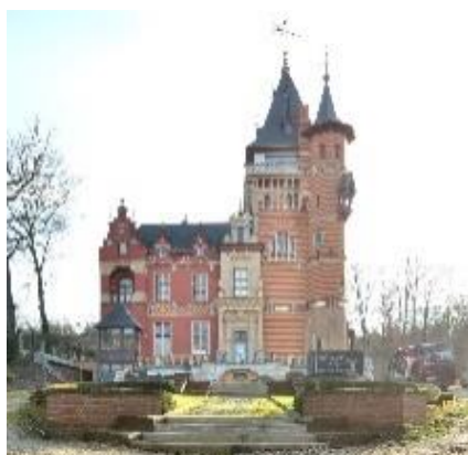
Façade avant

Le château et son jardin ont été réalisés en style néo-Renaissance flamand, selon les plans de l'architecte Charle-Albert entre 1870 et 1887. Situés en bordure de la forêt de Soignes et abandonnés à partir des années 1980, le château et ses abords ont depuis les années 2000 subi deux importantes campagnes de restauration et de rénovation, dont la dernière est toujours en cours.