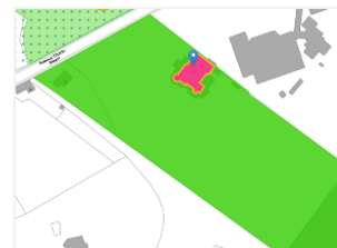
Implantation du château

Par arrêté du 08/08/1988 sont classés comme monument les façades et toitures du château Charle-Albert et comme site ses abords immédiats. Le site se situe en ZICHEE au PRAS et est partiellement repris en zone spéciale de conservation Natura 2000.