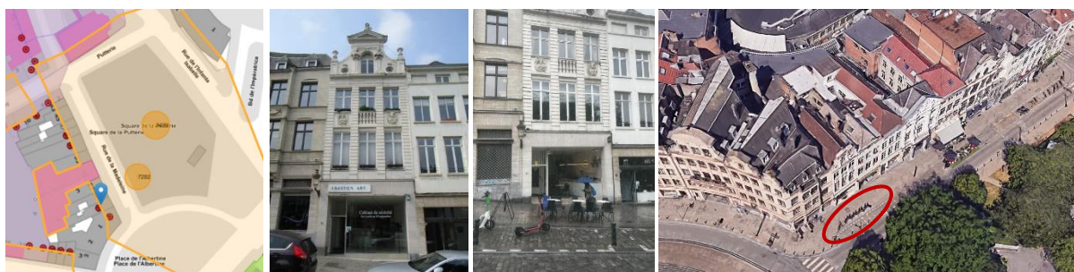
Inplanting en vrijwaringszone van de Bortiergalerij (© Brugis), pand nr. 61 gebruikt als kunstgalerie (© urban.brussels) en bestaande toestand (foto uit het aanvraagdossier, voorziene inplanting van het terras (© Google Streetview)

De aanvraag betreft het plaatsen van een vast terras op de stoep voor het huis aan de Magdalenasteenweg 61. Dit diephuis uit het begin van de 18de eeuw is ingeschreven op de wettelijke inventaris. De interventiezone is gelegen in de vrijwaringszone van de Bortiergalerij die toegankelijk is via het pand op nummer 55.